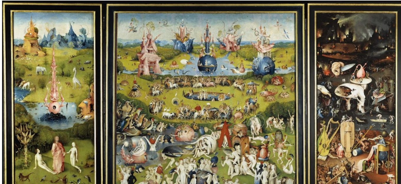
Jeroen Bosch, Tuin der lusten